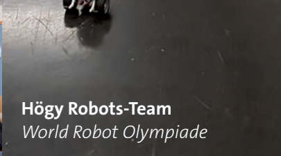
Högy Robots-Team World Robot Olympiade